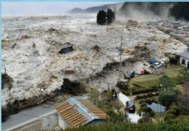
A chegada de um tsunami à cidade de Miyako, Iwate, Japão no dia 11 de março de 2011.

Um tsunami é uma série de ondas causadas pelo deslocamento súbito de um grande volume de água. Estas ondas podem chegar à costa em minutos, mas podem continuar por várias horas. Os tsunamis podem ser gerados por um grande sismo costeiro ou submarino longe da costa, deslizamentos de terra, erupções vulcânicas, perturbações da pressão atmosférica (meteo-tsunamis) ou impactos de grandes meteoritos. Portugal Continental pode ser afetado por várias fontes conhecidas que se encontram junto da sua costa. Mas existem também fontes distantes no Atlântico com possível impacto em Portugal Continental, Açores e Madeira. Os Açores, pela sua natureza vulcânica, podem ser afetados por tsunamis de carácter local. Outros países desta região estão igualmente expostos a tsunamis ao longo da costa do Atlântico (p.e., Espanha, Marrocos).