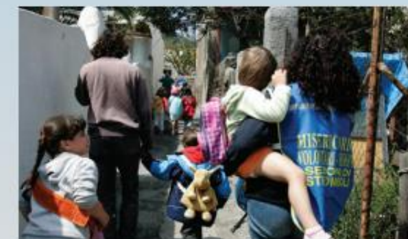
Evacuação da população da área de perigo de tsunamis durante um exercício na Ilha de Stromboli (Itália), em 2005.