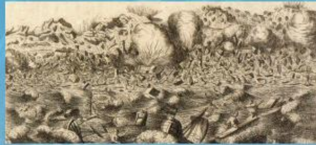
Sismo e tsunami em Lisboa, 1 de Novembro de 1755.

O relato mais antigo de um tsunami afetando Portugal data de 60 BC. O catálogo nacional inclui um total de 11 tsunamis originados por sismos no oceano Atlântico nos últimos 2000 anos. As zonas costeiras foram ainda afetadas por 3 tsunamis causados por deslizamentos de terras. Apenas no século XX Açores, Madeira e Portugal Continental sofreram os efeitos de 3 tsunamis causados por sismos de magnitude superior a 7. Felizmente os seus efeitos foram sentidos apenas nos portos, tendo sido contudo registados pelos maregrafos. O terramoto de 1 de Novembro de 1755 gerou um tsunami que devastou as costas de Portugal, do Sul de Espanha e Norte de Marrocos. Não é possível quantificar o número de vítimas associadas ao tsunami, mas foram alguns milhares. Hoje a ocupação da região costeira é muito mais densa, particularmente no verão, e por isso o número de pessoas em risco é muito maior.