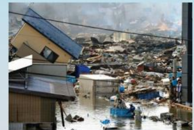
Muitas vezes os tsunamis deixam para trás água que fica estagnada e que contém resíduos perigosos. American Samoa, setembro de 2009.