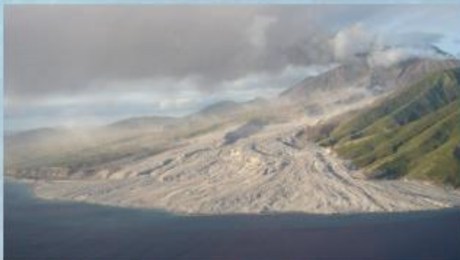
Avalanche de lama (mud flow) no Tar River Valley, Montserrat (Caraibas).