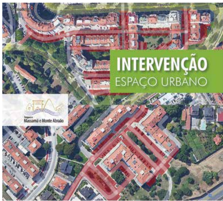
RECUPERAÇÃO DE VIAS RODOVIÁRIAS, EM MASSAMÁ